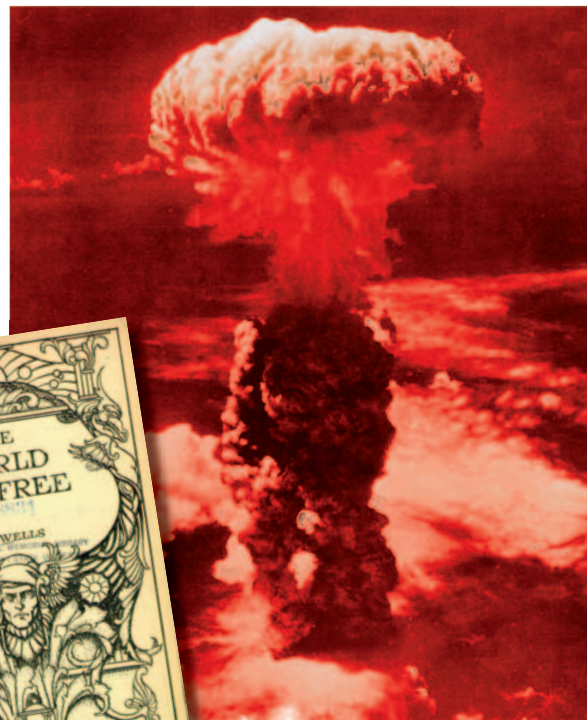
H. G. Wells ahnte bereits 1914 die Schrecken eines Atomkrieges (oben Atompilz über Nagasaki; links: Titelblatt von 1921).

„The history of mankind is the history of the attainment of external power.“, so beginnt H. G. Wells die Vorrede zu seinem Roman. Dies zeugt bereits von der naturwissenschaftlich-technischen Perspektive der Erzählung Wells, wie er sie auf den folgenden Seiten des Buches entwickelt. Historikern mag die These von der „Menschheitsgeschichte als Energiegeschichte“ vielleicht etwas verkürzt erscheinen, doch