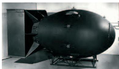
Die „Fat Man“ getaufte Atombombe, die am 9. August 1945 auf Nagasaki fiel. 1914 beschrieb Wells die fiktive Atombombe als „eine schwarze Kugel, zwei Fuß im Durchmesser.

(„continous explosion“) vor, die, ähnlich wie Radioaktivität, beständig leicht abnimmt: „Carolinum ... is never entirely exhausted, and to this day the battle-fields and bomb-fields of that frantic time in human history are sprinkled with radiant matter and so centers of inconvenient